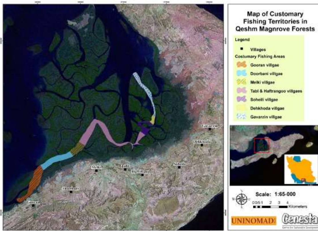
نقشه 2 قلمروهای عرفی صیادی جنگل‌های حرای جزیره قشم

در بخش شمالی جزیره قشم، پهنه عظیمی تحت پوشش جنگل‌های حرا است. صیادی سنتی در این محدوده توسط جامعه بومی و محلی انجام می‌شود. در بخش‌های جنوبی خورهای جنگل‌های حرا، روستاهای مجاور دارای قلمروهای عرفی صیادی هستند. البته این مرزها قراردادی و عرفی هستند و در صورت استفاده جامعه بومی روستاها از قلمرویی غیر از قلمروی روستای خودشان، تعارضی ایجاد نمی‌شود. سایر خورهای جزء مناطق آزاد و مشترک صیادی هستند. در نقشه شماره 2 قلمروهای عرفی صیادی محدوده جنگل‌های حرای جزیره قشم نشان داده شده‌است. در نقشه شماره 3 نیز نام‌های محلی خورها و سایر مکان‌های ساحلی دریایی محدوده جنگل‌های حرای جزیره قشم ارائه شده‌است.