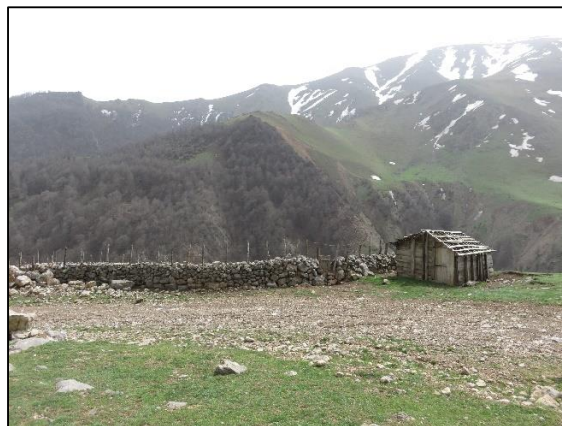
بیلاق تالش در استان گیلان

فهرست اغلب گونه‌های گیاهی جنگل های هیرکانی