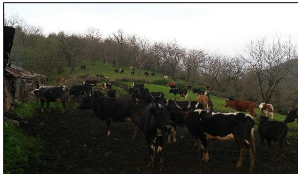
بیلاق گالش در استان مازندران