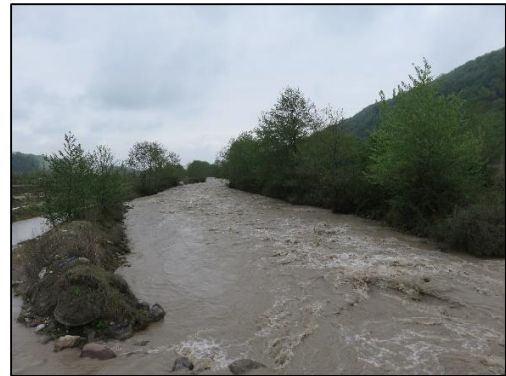
قشلاق گالش در استان مازندران