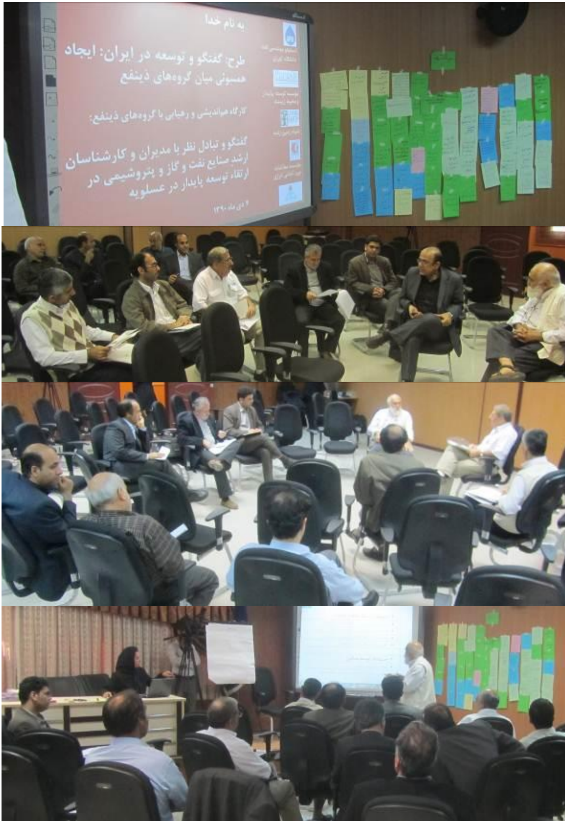
کارگاه مشارکتی مدیران و کارشناسان ارشد صنایع نفت، گاز و پتروشیمی، ۷ دی ماه ۱۳۹۰