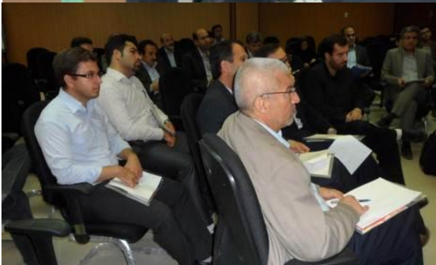
کارگاه مشارکتی مدیران و کارشناسان ارشد سازمان منطقه ویژه اقتصادی انرژی پارس - ۲۹ آذر ماه ۱۳۹۰